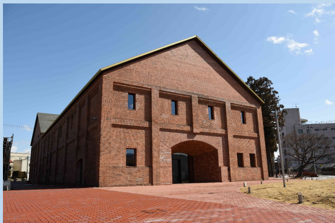
弘前れんが倉庫美術館