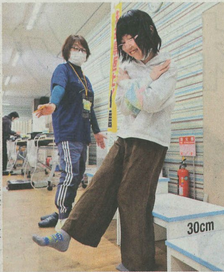
QOL健診で立ち上がりテストに挑戦する子ども

「ウェルビーイング(心も体も健康で幸せ)のヒントをみつけよう」をテーマに、弘前市が主催し、弘前大